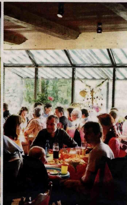
Gutes Essen und eine von regionalen Traditionen geprägte Dekoration machen den Gasthof Bärenfels zur Attraktion